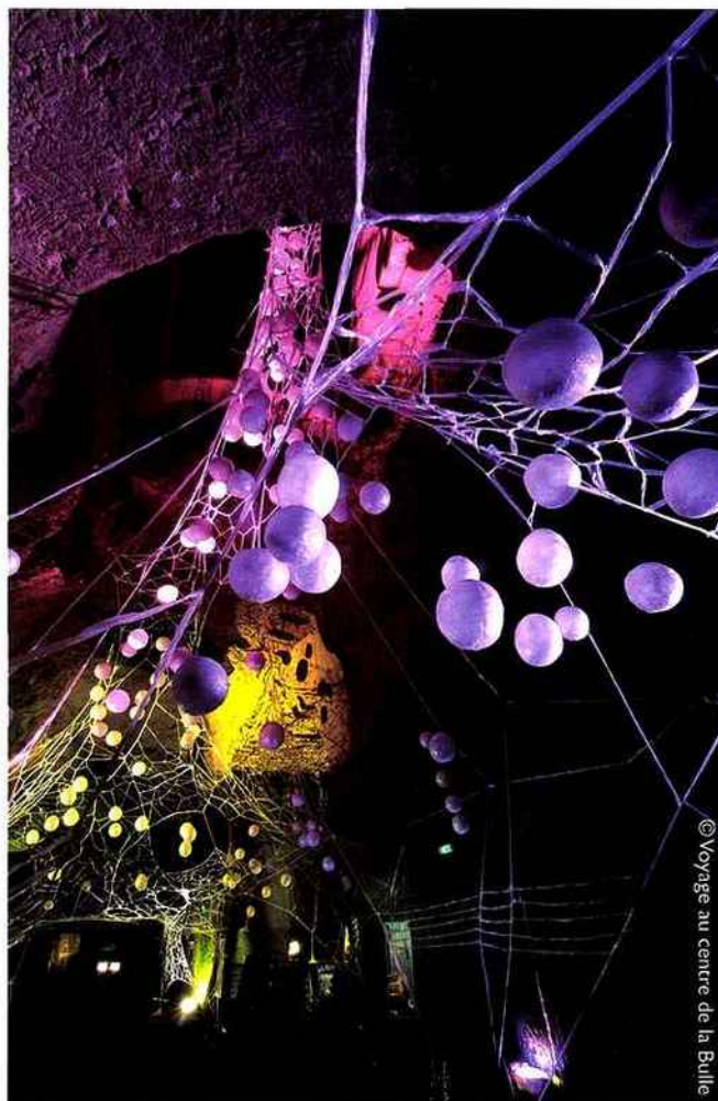
© Voyage au centre de la Bulle

Après l'histoire, rendez-vous dans le second espace décoré de fushia. Les visiteurs pourront y apprécier la dégustation de la cuvée tendance de la marque, le X noir. Dans cet espace coloré et envoûtant, le tuffeau joue avec les bulles aériennes et les alcôves s'habillent de créatures sous-marines. « Tout le long de la grotte, je joue avec l'aspect organique du tuffeau et les différentes aspérités de l'architecture grâce à un jeu d'ombres et de lumière. Les musiques originales dansantes ou chamaniques accompagnent la métamorphose de la caverne et le voyageur entre de manière réelle et irréelle dans la sculpture », décrit Yorga, plasticien performeur connu pour ses œuvres féériques. Enfin, la visite se termine par le monde « Crémantissime » vert où vous pourrez apprécier le salon et jouez en famille à des jeux anciens.