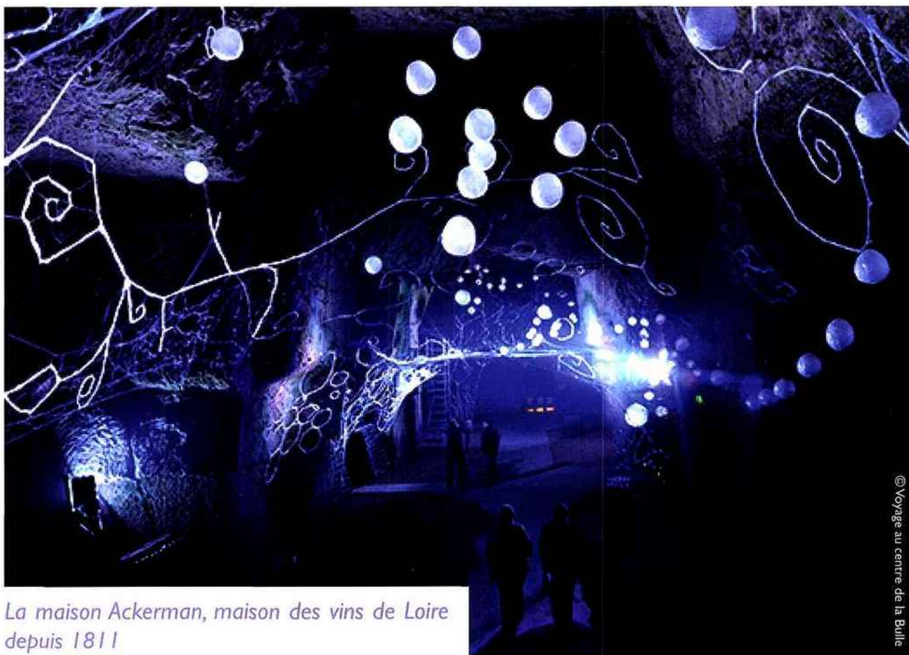
La maison Ackerman, maison des vins de Loire depuis 1811

Jules Verne n'aurait pas pu imaginer une scénographie plus propice au rêve et la dégustation que celle présentée par la maison Ackerman, 1 ère maison de vins de Loire depuis 1811. Nichée dans les caves troglodytes du Saumurois, l'exposition retrace l'histoire de cette maison qui emploie aujourd'hui 140 personnes et pèse 45,3 millions d'euros en chiffre d'affaires. Qu'il s'agisse de vins de pays ou d'appellations contrôlées (fines bulles et vins tranquilles